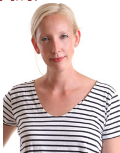
Sofia Arkelsten.

Moderaternas nya partisekreterare Sofia Arkelsten , gammal blackebergare av lite yngre årgång, student 1995, får väl i likhet med kungen vända blad och blicka framåt. Efter 2002 års val,