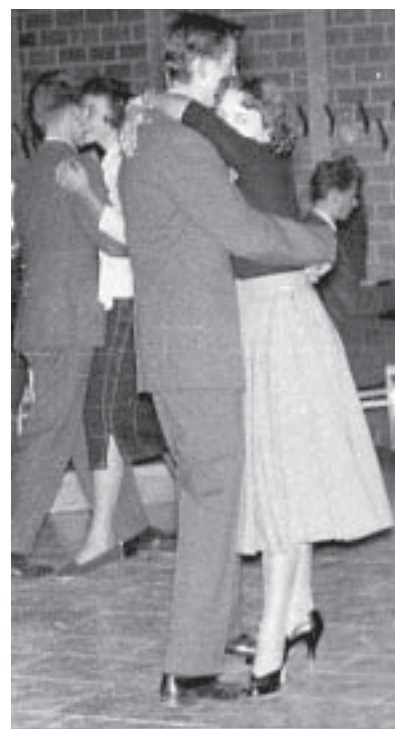
"Falubalen" 1954. Omslingrade i vimlet.