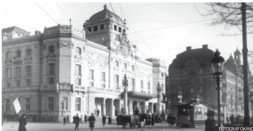
Dramaten på 1910-talet, äntligen i egen byggnad