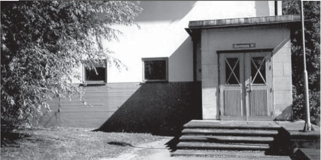
Ingången till gymnastiksalen vid Blackebergs sjukhus 2003.