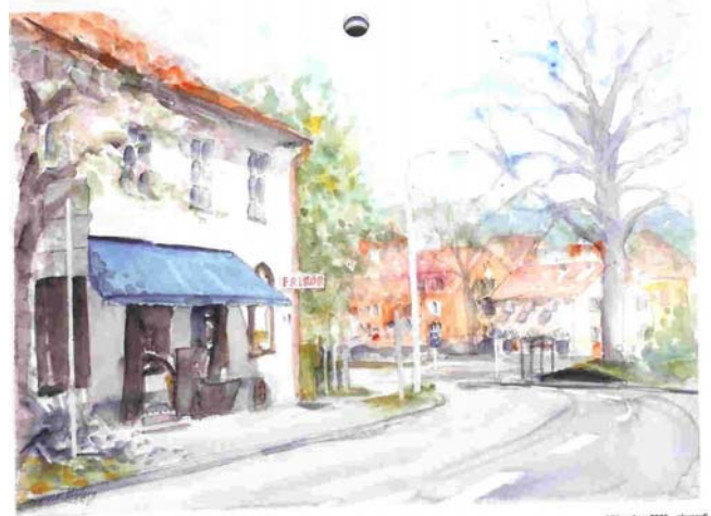
Alléparken 2005 - akvarell

Av riksintresse är förstås Stora journalistpriset. Till de nominerade i