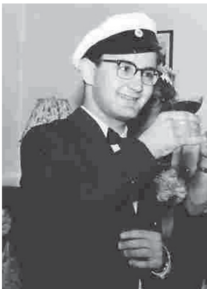
Artikelförfattaren som nybakad student.

Händelsen slogs upp stort i dagstidningarna. "Blackeberg blåste in vitmössetradition" förkunnade Dagens Nyheter. I den osignerade artikeln nämndes några studenter vilkas kän-