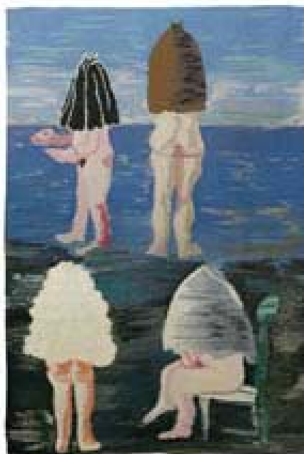
Fyra deppiga fruntimmer av Kaisa Melanton. Fler bilder och information finns på www.waldemarsudde.se

Kostnad: 100 kr för entré och visning Föranmälan senast den 2 april till Johan Högberg, tfn 08-30 76 03, e-post johan_hogberg@telia.com