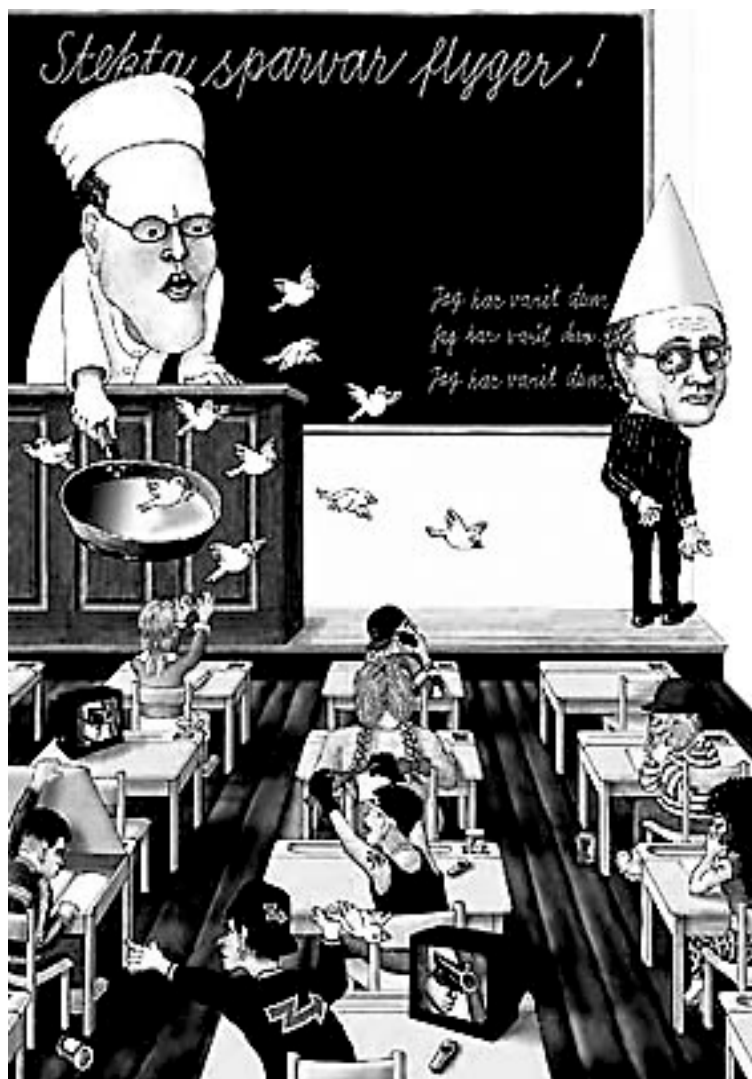
På svarta tavlan i skamvrån står det: Jag har varit dum.