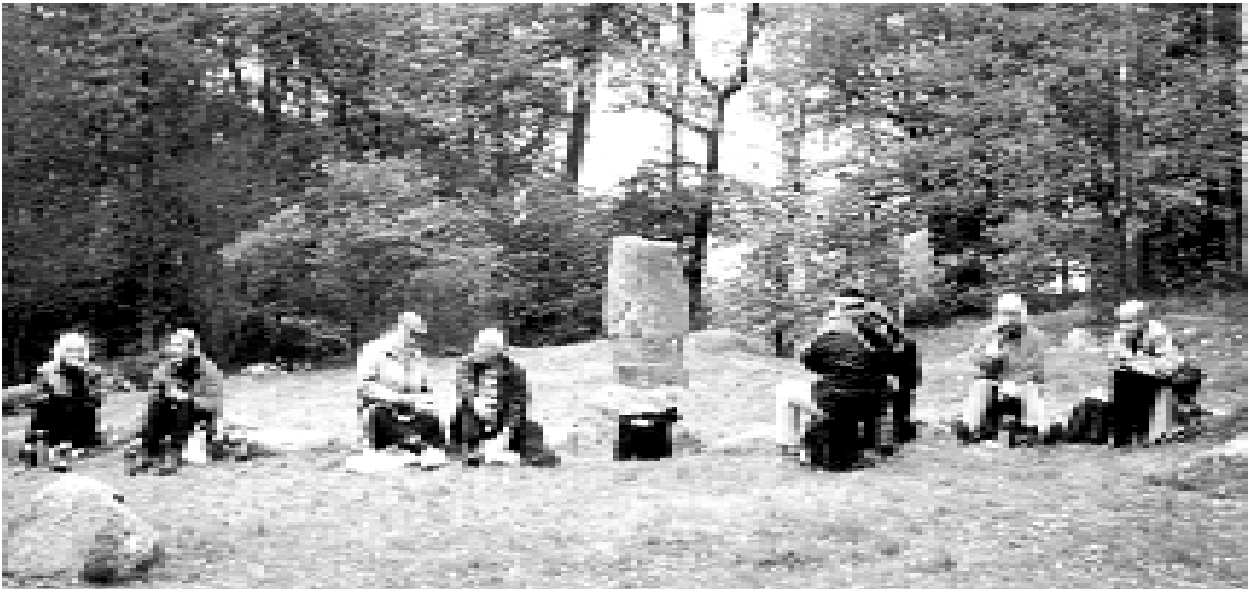
Gammal festplats: medhavd matsäck intogs vid det gamla tinget. På Jarlabankes tid var Vallentunasjöns närhet mer synlig.