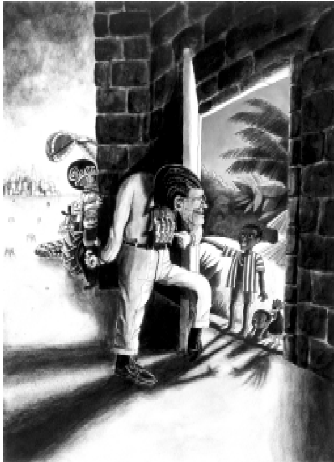
Världsbanken, en av de bilder som aldrig kan i tryck.