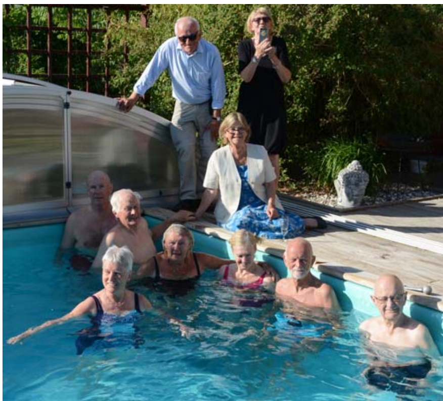
Hela styrelsen efter det sista mötet före sommaren.